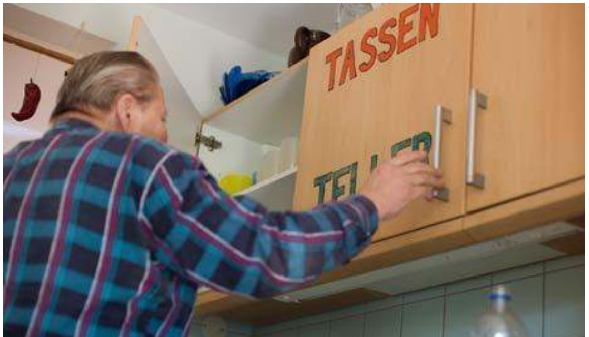
Demenzkranke Menschen benötigen Orientierungshilfen im Alltag.

Auch das Leistungsangebot in Heimen wird durch gesonderte Angebote der zusätzlichen Betreuung und Aktivierung für demenziell erkrankte