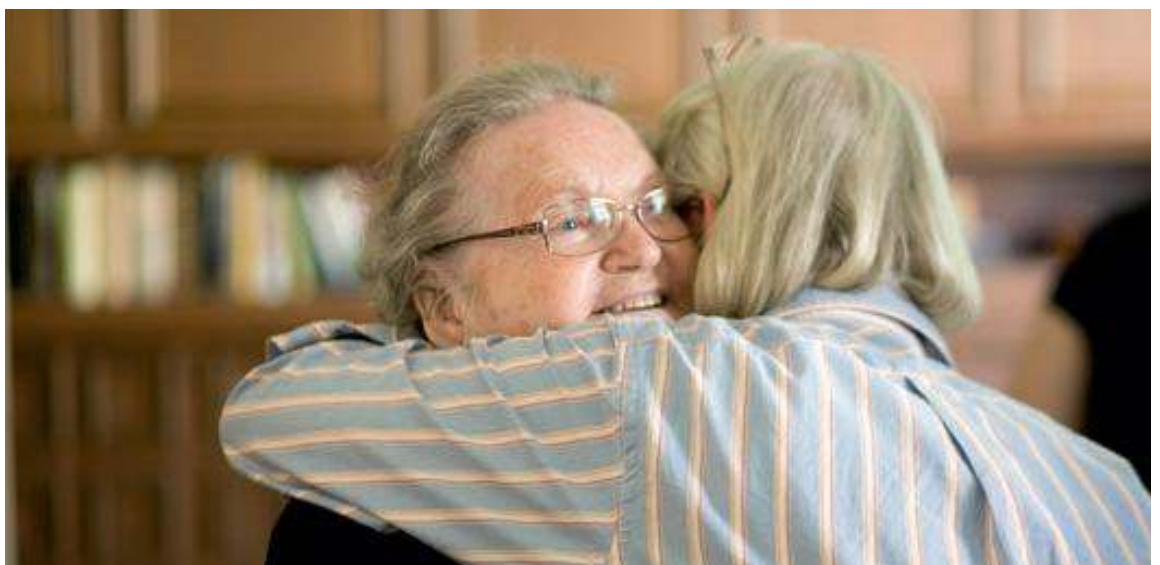
Die Pflegereform 2008: Mehr Zeit für- und miteinander.

Die Pflegereform – das Gesetz zur strukturellen Weiterentwicklung der Pflegeversicherung – passt die Strukturen in der Pflegeversicherung besser an die Bedürfnisse der Menschen an. Sie verbessert die Qualität der Pflege, macht gute und weniger gute Einrichtungen für Bürgerinnen und Bürger transparent und die erbrachten Leistungen besser vergleichbar. Und sie trägt dazu bei, dass pflegebedürftige Menschen so leben, wohnen und betreut werden, wie sie es gerne möchten.