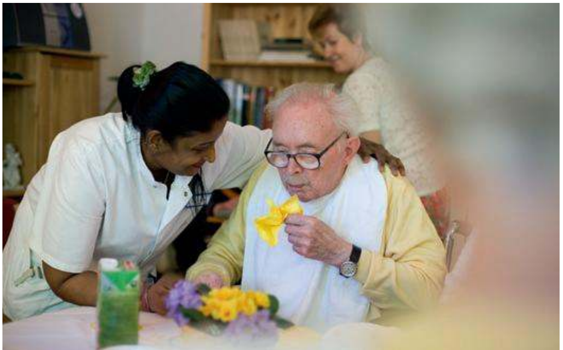
Der Medizinische Dienst der Krankenversicherung sichert die Qualität.

Die Einrichtungen können selbst Prüfungen veranlassen. Unter bestimmten Voraussetzungen ersetzen diese Prüfungen die Qualitätsprüfungen des MDK, soweit es um die Struktur- und Prozessqualität der Einrichtung geht. Die Ergebnisqualität, also der Pflegezustand der Menschen und die Wirksamkeit der Pflege- und Betreuungsmaßnahmen, wird aber immer vom MDK geprüft.