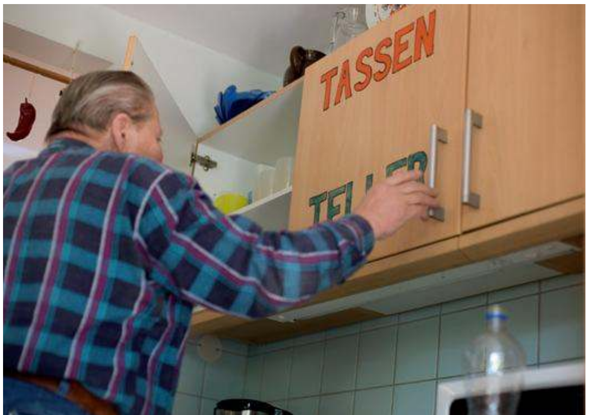
Demenzkranke Menschen benötigen Orientierungshilfen im Alltag.

Auch das Leistungsangebot in Heimen wird durch gesonderte Angebote der zusätzlichen Betreuung und Aktivierung für demenziell erkrankte Bewohner verbessert. In vollstationären Dauer- und Kurzzeitpflegeeinrichtungen kann zusätzliches Betreuungspersonal für Heimbewohnerinnen und -bewohner mit erheblichem allgemeinem Betreuungsbedarf eingesetzt werden. Diese Kosten werden durch die gesetzlichen und privaten Pflegekassen entsprechend den vereinbarten Regelungen getragen. Pflegebedürftige