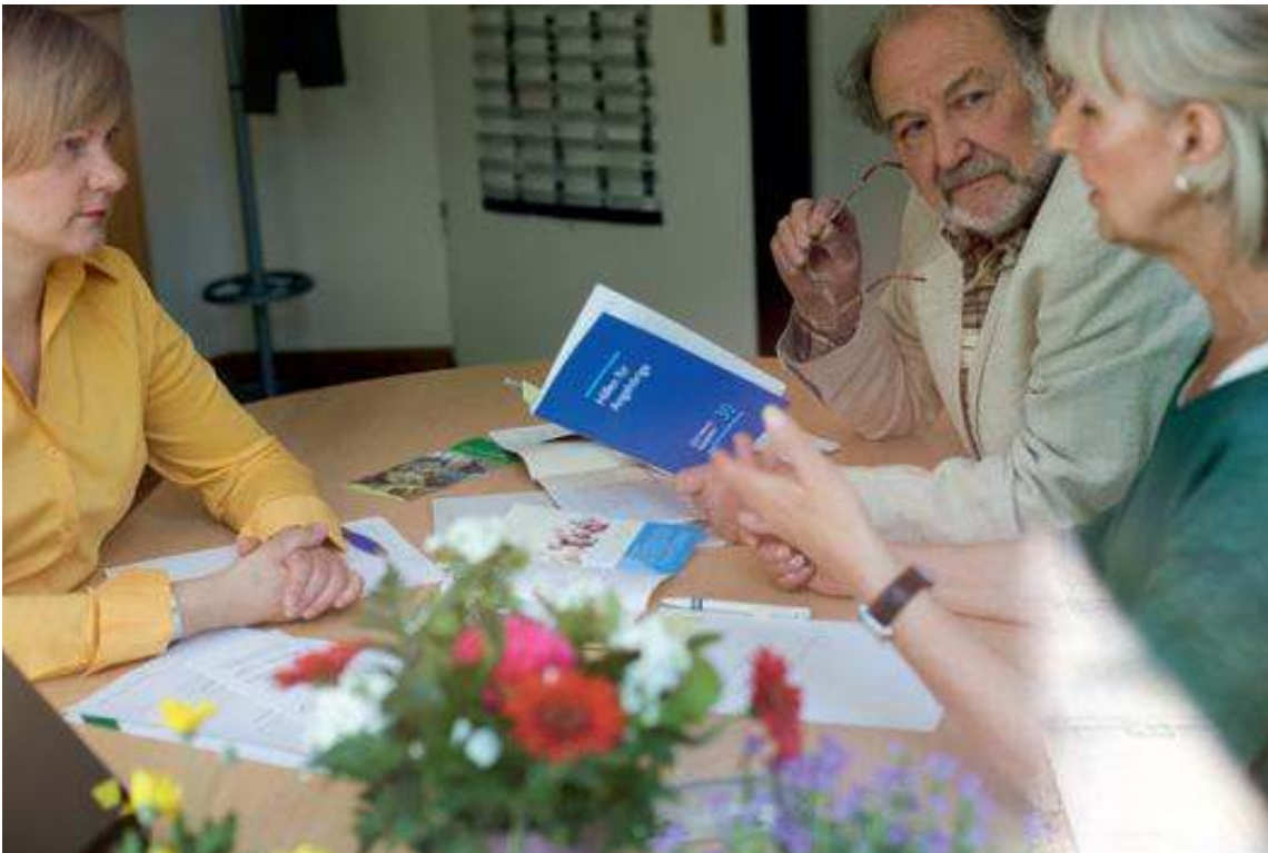
Die Pflegereform erhöht schrittweise die Leistungen. Dazu wird der Beitragssatz angehoben.

Die Anhebung des Beitragssatzes um 0,25 Prozentpunkte führt in der sozialen Pflegeversicherung zu jährlichen Mehreinnahmen von rund 2,5 Mrd. Euro. Da der Beitragssatz zum 1. Juli 2008 angehoben wird, betragen die Mehreinnahmen im Jahr 2008 rund 1,3 Mrd. Euro. Dagegen stehen Mehr-